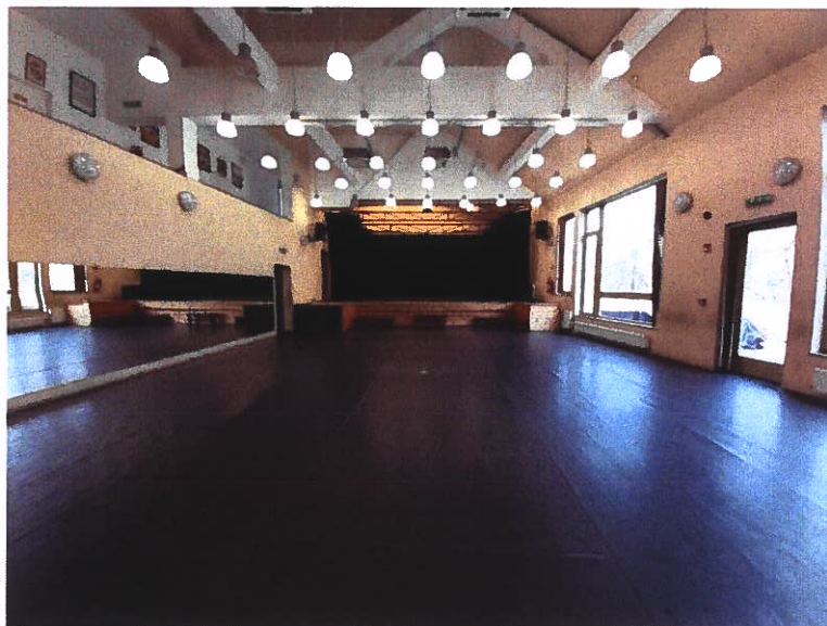
A/ terem – nagy próbaterem színpaddal

Az együttes székházában két próbaterem található. Mindkét terem elfoglaltság szempontjából igen leterhelt, a csoportoknak, a felkészülő tanároknak, az oktatóknak, a zenészeknek szoros beosztást igényel, mint az látható is a képek alatti táblázatban. Jelen pillanatban 250 fő felnőtt, hagyományőrző, ifjúsági, gyermek táncos, zenész művészeti oktatása történik a hét minden napján a Víz utcai székház épületében.