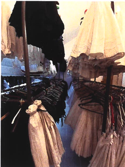
Emeleti ruhatár 1.

A székház emeletén két helyiségben az együttesek népviseleteit tároljuk. Viseleteink nagy része eredeti, melyeket nem tudnánk a mai világban ismét beszerezni. Nagyon értékesek, melyeknek szakszerű tárolására oda kell figyelni. Jelenleg a két helyiség már nem elegendő, így az emeleti folyosó is ezt a célt szolgálja, illetve táncosok otthon is tárolnak együttesi népviseleteket.