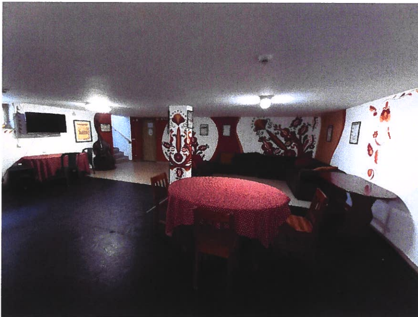
Színpad alatti pince – közösségi tér

Pincehelységünk közösségi tér, mely alkalmanként próbateremként is szolgál. Amennyiben a fenti táncteremek foglaltak, itt kerül sor kamara táncpróbákra, néprajzi ismeretterjesztő előadások megtartására, népdaltanításra, zeneoktatásra. A helyiség tárgyaló teremként is funkcionál.