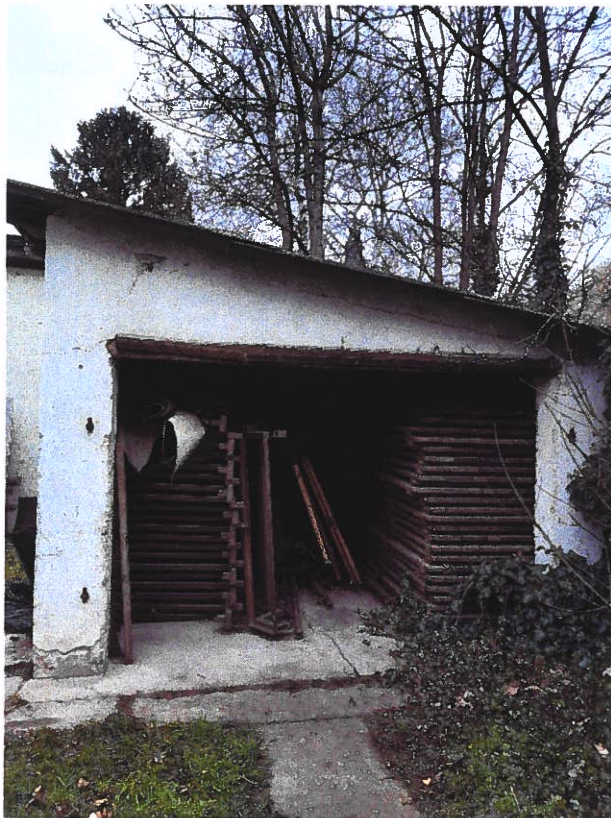
Garázs épülete az iroda udvarán – nyitott raktárhelység

Sajnos továbbra sincs megfelelő külön helyiségünk az együttes díszleteinek, kellékeinek, a Csángó Fesztivál eszközeinek, így többek közt a padlástér, a pince szolgál raktárként, valamint a nyitott garázsban van tárolva a 80 m 2 mobil színpadunk, mely színpad számos jászberényi rendezvényen kerül felállításra. Ezek a helyiségek mind felújítást igényelnek, állaguk folyamatosan romlik. Az udvaron elengedhetetlenül szükség lenne egy térkövezésre, valamint egy garázsajtó felszerelésére.