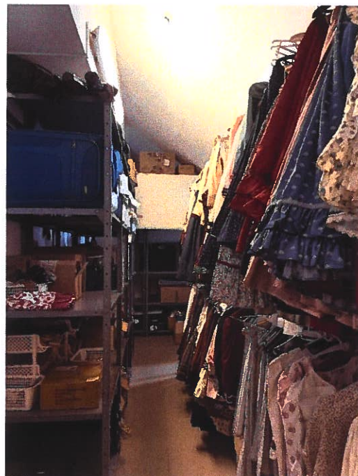
Emeleti ruhatár 2.

Az emeleti stúdióban a szakmai anyagaink, technikai eszközeink egy része található. Itt tároljuk az együttes saját régi gyűjtéseit, a 80-as évektől rendszeresen filmeztünk adatközlő táncosokat, zenészeket, énekeseket. Felbecsülhetetlen eszmei értékek vannak filmre véve, melyeknek digitalizálása folyamatosan történik. Együtteseink fotóinak archiválását is ezen helyiségben végzik a kollegák. A székházában megrendezendő koncertekhez, táncházakhoz, zenei felvételekhez szükséges eszközeit (mikrofonok, állványok stb.) szintén itt tároljuk. Saját gyűjtéseinkhez szükséges technika (kamerák, hangrögzítők stb.) is itt kap helyet. Eszközeink tárolására a helyiség szűkös. A stúdió egyben a technikus munkavégzési helyszíne is.