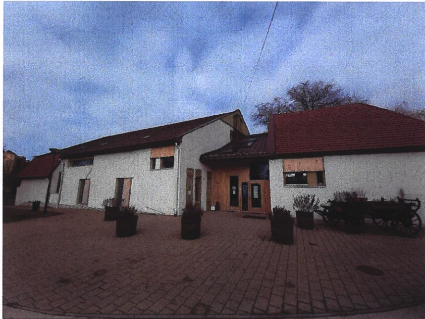
A Víz utcai Székház épülete

A 2013-ban átadott Székházban található egy nagyterem színpaddal (A terem), egy kisterem (B terem), két fiú és két női öltöző illemhelyekkel, mosdókkal, különálló férfi és női illemhelyek mosdókkal, egy rokkantaknak biztosított illemhely, egy orvosi szoba, egy gépház. A ház emeletén egy kisebb tetőtéri raktár, egy stúdió, két helyiség a népviseletek tárolására, egy mosószárító, varró szoba és egy gépház található. A színpad alatt helyezkedik el a pince.