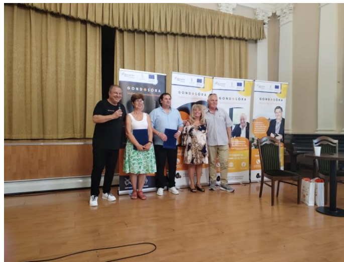
5. kép 2025. június hó – Gondosórával kapcsolatos tudnivalók, tapasztalatok