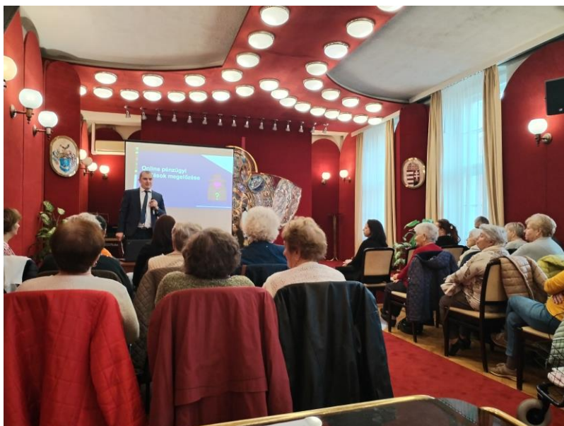
9. kép 2025. november – Pénzügyi csalások megelőzése c. előadás