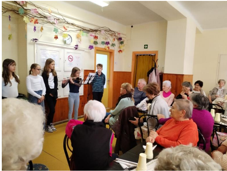
8. kép 2025. október – Idősek Világnapja alkalmából általános iskolások köszöntője