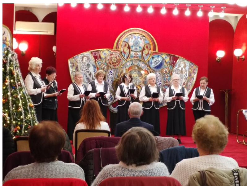
10. kép 2025. december – Idősek karácsonya, ünnepélyes rendezvény (gyermekműsor)